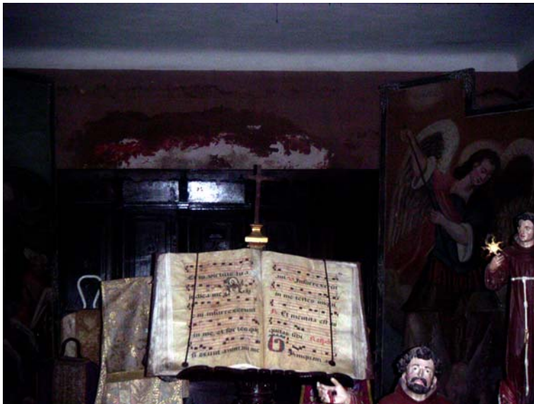
SALMO CAPITULO 101, 2. cursaré el camino de la perfección

SELECCIÓN PARA EL 20 DE FEBRERO 2CORINTIOS CAPITULO 4 5. No nos predicamos a nosotros mismos, sino a Cristo Jesús como Señor, y a nosotros como siervos vuestros por Jesús. 6. Pues el mismo Dios que dijo: De las tinieblas brille la luz, ha hecho brillar la luz en nuestros corazones, para irradiar el conocimiento de la gloria de Dios que está en la faz de Cristo. 7. Pero llevamos este tesoro en recipientes de barro para que aparezca que una fuerza tan extraordinaria es de Dios y no de nosotros. 8. Atribulados en todo, mas no aplastados; perplejos, mas no desesperados; 9. perseguidos, mas no abandonados; derribados, mas no aniquilados. 10. Llevamos siempre en nuestros cuerpos por todas partes el morir de Jesús, a fin de que también la vida de Jesús se manifieste en nuestro cuerpo. 11. Pues, aunque vivimos, nos vemos continuamente entregados a la muerte por causa de Jesús, a fin de que también la vida de Jesús se manifieste en nuestra carne mortal. 12. De modo que la muerte actúa en nosotros, mas en vosotros la vida.