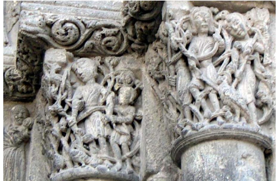
SALMO CAPITULO 25, 15. Mis ojos están fijos en Yahveh, que él sacará mis pies del cepo.