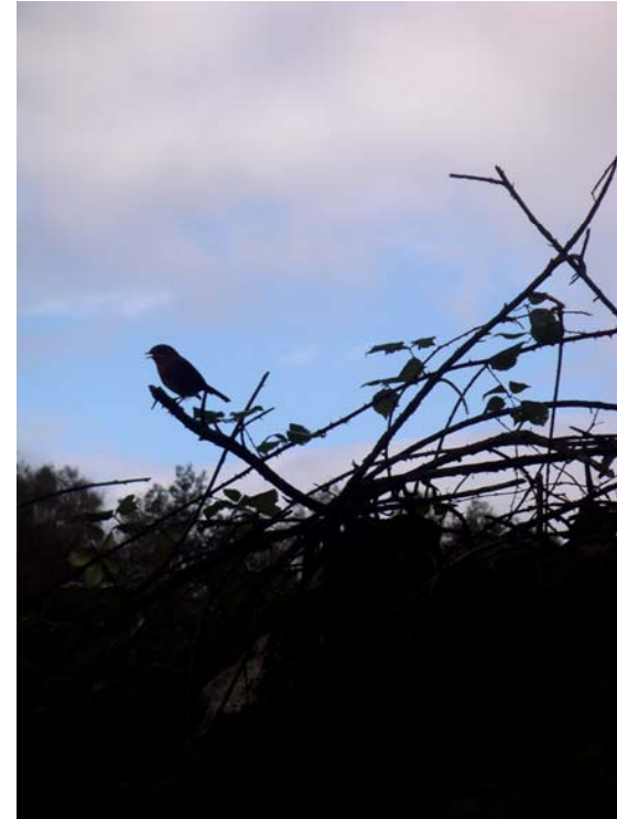
MATEO CAPITULO 6, 26. Mirad las aves del cielo....

MATEO CAPITULO 6 25. «Por eso os digo: No andéis preocupados por vuestra vida, qué comeréis, ni por vuestro cuerpo, con qué os vestiréis. ¿No vale más la vida que el alimento, y el cuerpo más que el vestido? 26. Mirad las aves del cielo: no siembran, ni cosechan, ni recogen en graneros; y vuestro Padre celestial las alimenta. ¿No valéis vosotros más que ellas? 27. Por lo demás, ¿quién de vosotros puede, por más que se preocupe, añadir un solo codo a la medida de su vida? 28. Y del vestido, ¿por qué preocuparos? Observad los lirios del campo, cómo crecen; no se fatigan, ni hilan. 29. Pero yo os digo que ni Salomón, en toda su gloria, se vistió como uno de ellos. 30. Pues si a la hierba del campo, que hoy es y mañana se echa al horno, Dios así la viste, ¿no lo hará mucho más con vosotros, hombres de poca fe? 31. No andéis, pues, preocupados diciendo: ¿Qué vamos a comer?, ¿qué vamos a beber?, ¿con qué vamos a vestirnos? 32. ... [P]ues ya sabe vuestro Padre celestial que tenéis necesidad de todo eso. 33. Buscad primero su Reino y su justicia, y todas esas cosas se os darán por añadidura. 34. Así que no os preocupéis del mañana: el mañana se preocupará de sí mismo. Cada día tiene bastante con su propio mal.»