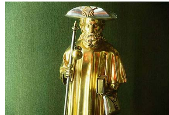
2CORINTIOS CAPITULO 4, 12. De modo que la muerte actúa en nosotros, mas en vosotros la vida.

SELECCIÓN PARA EL 20 DE FEBRERO 2CORINTIOS CAPITULO 4 5. No nos predicamos a nosotros mismos, sino a Cristo Jesús como Señor, y a nosotros como siervos vuestros por Jesús. 6. Pues el mismo Dios que dijo: De las tinieblas brille la luz, ha hecho brillar la luz en nuestros corazones, para irradiar el conocimiento de la gloria de Dios que está en la faz de Cristo. 7. Pero llevamos este tesoro en recipientes de barro para que aparezca que una fuerza tan extraordinaria es de Dios y no de nosotros. 8. Atribulados en todo, mas no aplastados; perplejos, mas no desesperados; 9. perseguidos, mas no abandonados; derribados, mas no aniquilados. 10. Llevamos siempre en nuestros cuerpos por todas partes el morir de Jesús, a fin de que también la vida de Jesús se manifieste en nuestro cuerpo. 11. Pues, aunque vivimos, nos vemos continuamente entregados a la muerte por causa de Jesús, a fin de que también la vida de Jesús se manifieste en nuestra carne mortal. 12. De modo que la muerte actúa en nosotros, mas en vosotros la vida.