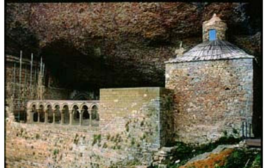
1 REYES CAPITULO 19, 9. Allí entró en la cueva, y pasó en ella la noche.