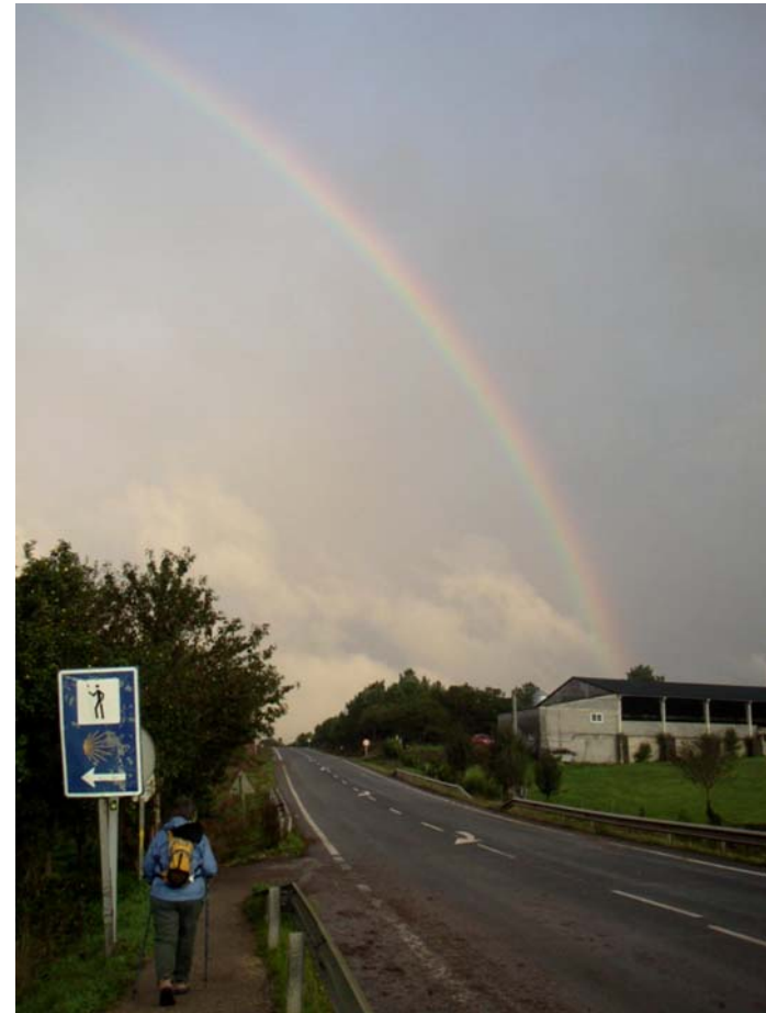
Año Santo Compostelano 2004.

SELECCIÓN PARA EL 29 DE FEBRERO: Iglesia de San Juan. Portomarín. Octubre de 2004.