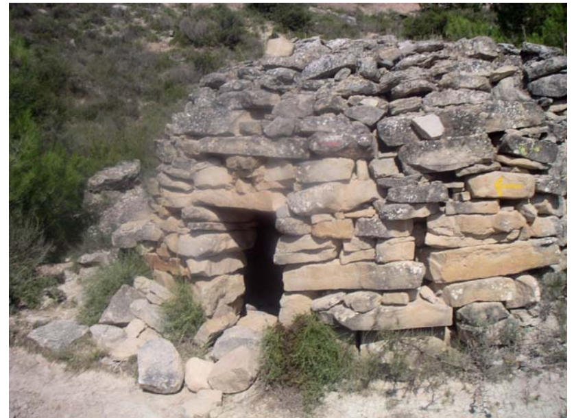
SALMO CAPITULO 55, 8. Huiría entonces lejos, en el desierto moraría.

SELECCIÓN PARA EL 18 DE FEBRERO SALMO CAPITULO 55. Escucha, oh Dios, mi oración, no te retraigas a mi súplica, 3. dame oídos, respóndeme, en mi queja me agito. Gimo 4. ante la voz del enemigo, bajo el abucheo del impío; pues vierten sobre mí falsedades y con saña me hostigan. 5. Se me estremece dentro el corazón, me asaltan pavores de muerte; 6. miedo y temblor me invaden, un escalofrío me atenaza. 7. Y digo: ¡Quién me diera alas como a la paloma para volar y reposar! 8. Huiría entonces lejos, en el desierto moraría. 9. En seguida encontraría un asilo contra el viento furioso y la tormenta. 10. ¡Oh, piérdelos, Señor, enreda sus lenguas!, pues veo discordia y altercado en la ciudad.... 17. Yo, en cambio, a Dios invoco, y Yahveh me salva.... 23. Descarga en Yahveh tu peso, y él te sustentará; no dejará que para siempre zozobre el justo. 24. ... Mas yo confío en ti.