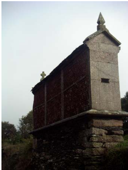
LUCAS CAPITULO 12, 18. Y dijo: 'Voy a hacer esto: Voy a demoler mis graneros, y edificaré otros más ....

SELECCIÓN PARA EL 17 DE FEBRERO LUCAS CAPITULO 12 13. Uno de la gente le dijo: «Maestro, di a mi hermano que reparta la herencia conmigo.» 14. El le respondió: «¡Hombre! ¿quién me ha constituido juez o repartidor entre vosotros?» 15. Y les dijo: «Mirad y guardaos de toda codicia, porque, aun en la abundancia, la vida de uno no está asegurada por sus bienes.» 16. Les dijo una parábola: «Los campos de cierto hombre rico dieron mucho fruto; 17. y pensaba entre sí, diciendo: '¿Qué haré, pues no tengo donde reunir mi cosecha?' 18. Y dijo: 'Voy a hacer esto: Voy a demoler mis graneros, y edificaré otros más grandes y reuniré allí todo mi trigo y mis bienes, 19. y diré a mi alma: Alma, tienes muchos bienes en reserva para muchos años. Descansa, come, bebe, banquetea.' 20. Pero Dios le dijo: '¡Necio! Esta misma noche te reclamarán el alma; las cosas que preparaste, ¿para quién serán?' 21. Así es el que atesora riquezas para sí, y no se enriquece en orden a Dios.»