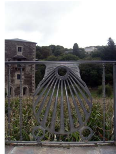
LUCAS CAPITULO 17, 21. porque el Reino de Dios ya está entre vosotros....

SELECCIÓN PARA EL 22 DE FEBRERO LUCAS CAPITULO 17 20. Habiéndole preguntado los fariseos cuándo llegaría el Reino de Dios, les respondió: «El Reino de Dios viene sin dejarse sentir. 21. Y no dirán: 'Vedlo aquí o allá', porque el Reino de Dios ya está entre vosotros.»