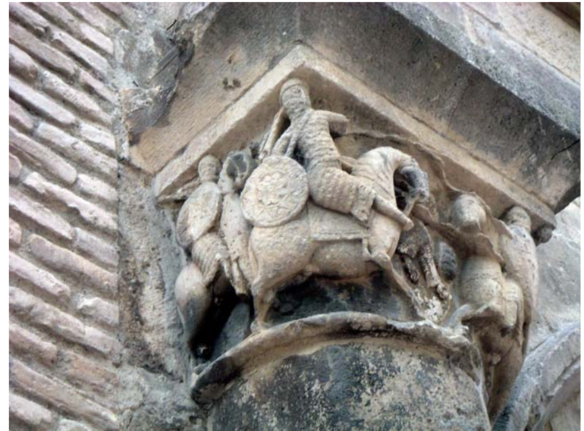
SALMO CAPITULO 147 10. No le agrada el brío del caballo ....