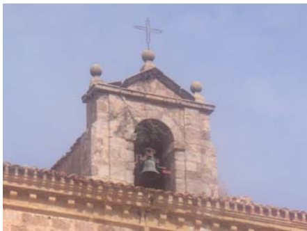
SALMO CAPITULO 66, 1.... Aclamad a Dios, la tierra toda

SELECCIÓN PARA EL 21 DE FEBRERO SALMO CAPITULO 66 1.... Aclamad a Dios, la tierra toda, 2. salmodiad a la gloria de su nombre, rendidle el honor de su alabanza, 3. decid a Dios: ¡Qué terribles tus obras! Por la grandeza de tu fuerza, tus enemigos vienen a adularte; 4. toda la tierra se postra ante ti, y salmodia para ti, a tu nombre salmodia. 5. Venid y ved las obras de Dios, temible en sus gestas por los hijos de Adán: 6. él convirtió el mar en tierra firme, el río fue cruzado a pie. Allí, nuestra alegría en él, 7. que por su poder domina para siempre. Sus ojos vigilan las naciones, no se alcen los rebeldes contra él. 8. Pueblos, bendecid a nuestro Dios, haced que se oiga la voz de su alabanza, 9. él, que devuelve nuestra alma a la vida, y no deja que vacilen nuestros pies. 10. Tú nos probaste, oh Dios, nos purgaste, cual se purga la plata; 11. nos prendiste en la red, pusiste una correa a nuestros lomos, 12. dejaste que un cualquiera a nuestra cabeza cabalgara, por el fuego y el agua atravesamos; mas luego nos sacaste para cobrar aliento.... 16. Venid a oír y os contaré, vosotros todos los que teméis a Dios, lo que él ha hecho por mí. 17. A él gritó mi boca, la alabanza ya en mi lengua. 18. Si yo en mi corazón hubiera visto iniquidad, el Señor no me habría escuchado. 19. Pero Dios me ha escuchado, atento a la voz de mi oración. 20. ¡Bendito sea Dios, que no ha rechazado mi oración ni su amor me ha retirado!