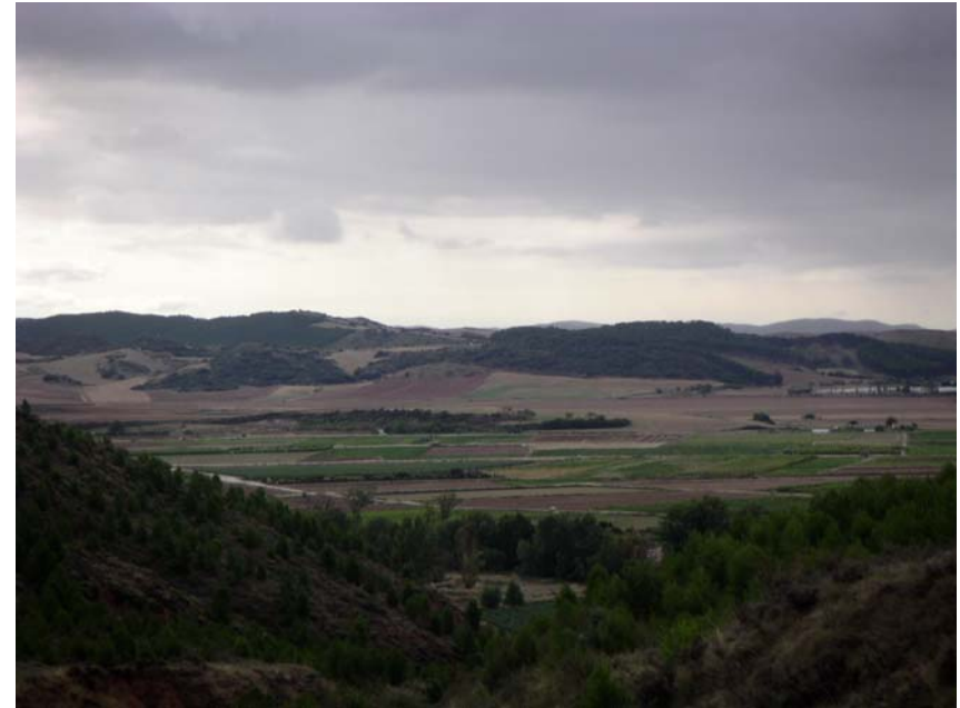
SALMO CAPITULO 10, 1. ¿Por qué, Yahveh, te quedas lejos, te escondes en las horas de la angustia?